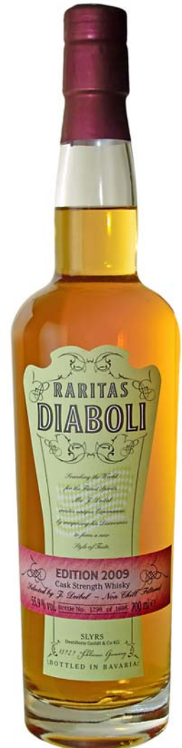
Raritas Diaboli Edition 2009 55,9%, 1698 Flaschen

Manchmal entsteht etwas Besonderes, wenn sich Freunde zusammentun, so geschehen im Herbst 2007. Die drei befreundeten Unternehmen Deibel Consultants, SLYRS Destillerie und Irisch Lifestyle trafen sich auf ein Glas Whisky am Schliersee und plötzlich war die Idee geboren: Raritas Diaboli .