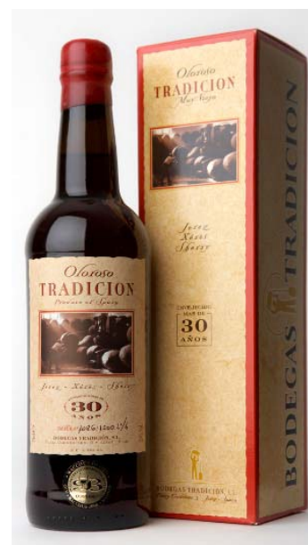
Oloroso VORS ca. 42 Jahre 5.000 Flaschen pro Jahr

V.O.R.S. bedeutet „vinum optimum rare signatum“ oder vereinfacht „very old rare sherry“. Diese gesetzlich geschützte Klassifizierung des amtlichen Kontrollrates (Consejo Regulador) garantiert nicht nur ein nachgewiesenes Mindestalter von mehr als 30 Jahren, sondern auch den Ursprung und die hervorragende Qualität des Sherrys.