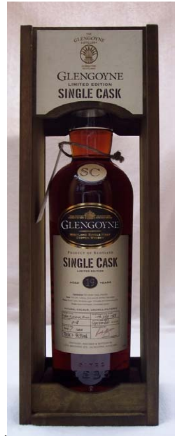
Glengoyne Single Cask 19y, 58,3% Cask Nr. 718