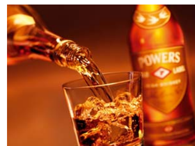
Irish Blend: Powers Gold Label

Blended Irish Whiskey ist nicht nur die kunstvolle Vermählung aus Grain Whiskey und Single Malt Whiskey, sondern der Irish Blended vermählt auch Irish Pure Pot Still Whiskey (siehe oben) mit Grain und Single Malt Whiskey. Diese besonders vielfältigen Möglichkeiten des Blendens erlauben es, in Irland eine geschmackliche Vielfalt zu erzeugen, die in der Welt ihresgleichen sucht.